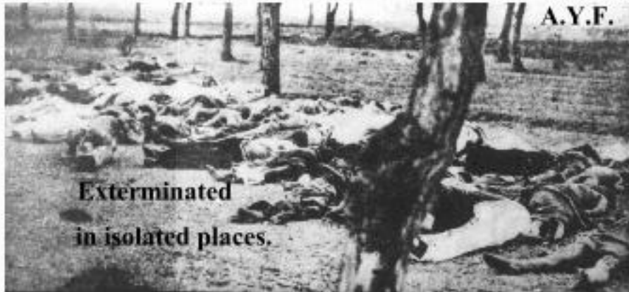
Exterminated in isolated places.