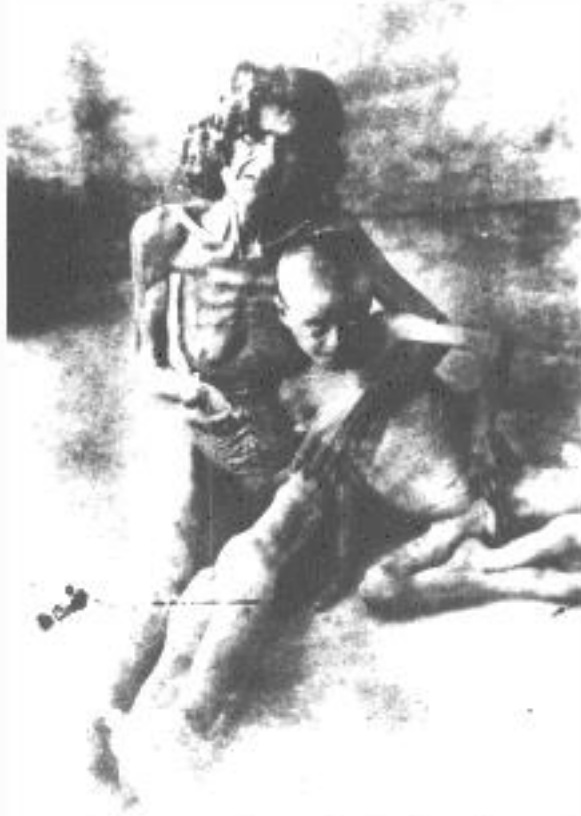
Human tragedy in the desert